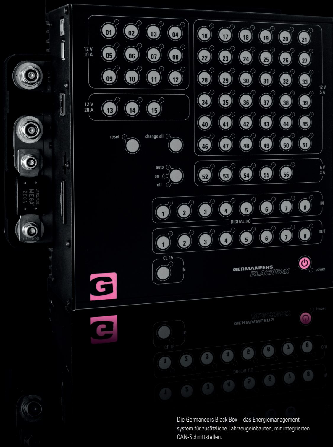
Die Germaneers Black Box – das Energiemanagement-system für zusätzliche Fahrzeugeinbauten, mit integrierten CAN-Schnittstellen.